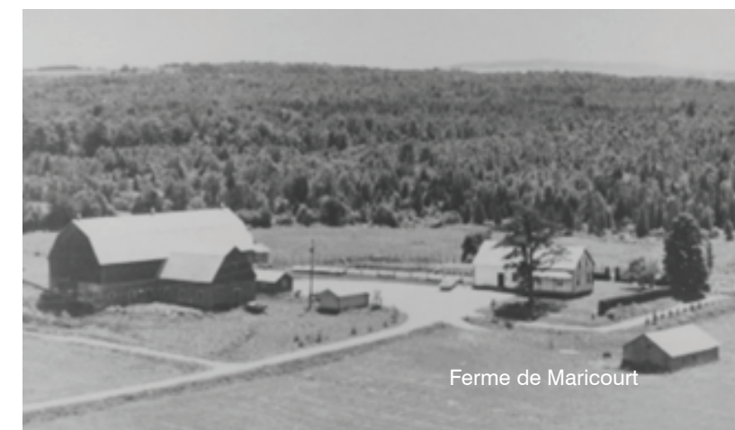
Ferme de Maricourt

Tout comme la maison du Ouest Ely, cette ferme et ses bâtiments nécessitaient énormément d'améliorations mais mes parents et tous les enfants se sont pris d'amour pour cette ferme. Les nombreux projets de rénovations qui s'additionnèrent au fil des ans en ont fait un havre de bonheur pour toute la famille. Maman avait son grand jardin tout près de la maison qui lui procurait beaucoup de satisfaction. Nous y avions notre petit carré de 10 pieds par 10 pieds où nous pouvions planter ce que nous voulions. Le père donnait aux garçons un petit veau de lait que nous vendions à 3 mois. Je me rappelle que j'avais eu 80 $ pour un tel veau un certain printemps...une fortune !